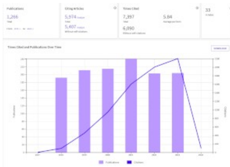
Fig. 1 Evoluția numărului de citări ale publicațiilor științifice în reviste indexate ISI, având autori/coautori din Facultatea de Fizică a Universității din București. Rezultatele au fost generate printr-o căutare în bazele de date ISI Clarivate, după criteriul “univ bucharest fac phys OR univ bucharest dept phys OR univ bucharest dept atom phys NOT univ bucharest dept phys chem” IN ADDRESS; perioada de referință este 2018-2023.

Facultatea de Fizică se încadrează în tendința națională în ceea ce privește finanțarea cercetării: lipsa de competiții naționale/europene va face ca numărul de proiecte de cercetare în execuție să scadă pe termen scurt, cu consecințe negative asupra rezultatelor viitoare. Tot la acest capitol trebuie amintită lipsa unor surse de finanțare pentru dotarea cu infrastructură de cercetare a laboratoarelor și lipsa unui program de tip NUCLEU pentru universități. Un astfel de program, de care beneficiază institutele de cercetare, este esențial pentru mentenanța echipamentelor și acoperirea cheltuielilor cu consumabile necesare derulării experimentelor și, mai ales, pentru menținerea grupurilor de cercetare constituite în facultate.